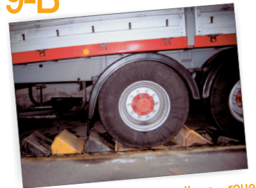
Dispositif de calage d'une roue du camion asservi au quai de transbordement