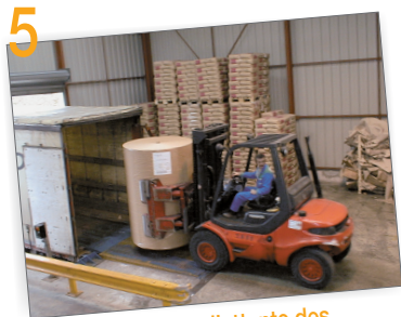
5 Local d'accueil et d'attente des transporteurs

BIEN CHOISIR SON CAMION, C'EST ÉVITER TOUT DÉSAGRÈMENT AU CHARGEMENT ET AU DÉCHARGEMENT ET LIMITER LES RISQUES.