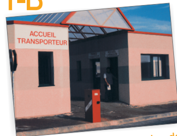
Local d'accueil et d'attente des transporteurs