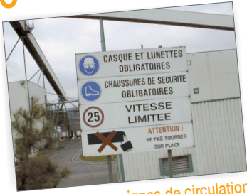
Panneau de consignes de circulation à l'entrée d'une entreprise