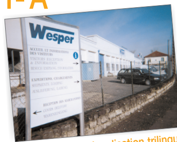
Le panneau de signalisation trilingue indique l'accueil des visiteurs et la réception des marchandises