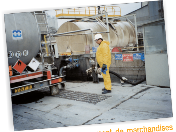
Opération de déchargement de marchandises d'un poids lourd à quai dans une entreprise d'accueil

La concertation entre l'entreprise d'accueil et le transporteur est essentielle pour la qualité de la prestation et pour la sécurité des personnels lors des opérations de chargement et de déchargement.