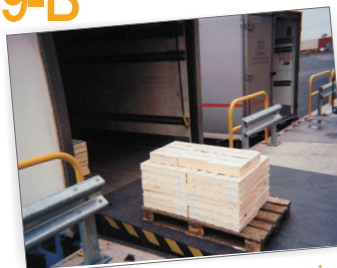
Quai équipé d'un dispositif de mise à niveau