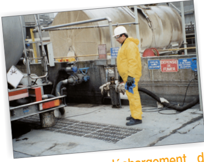
Opération de déchargement de marchandises d'un poids lourd à quai dans une entreprise d'accueil