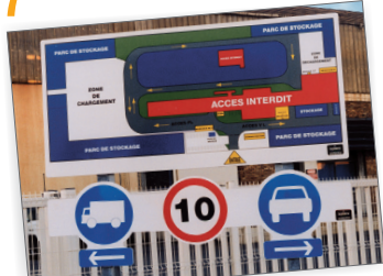
Plan de circulation et panneau de signalisation à l'entrée d'un établissement industriel

BIEN DÉFINIR LES CONDITIONS DE MANUTENTION, C'EST PLUS DE SÉCURITÉ.