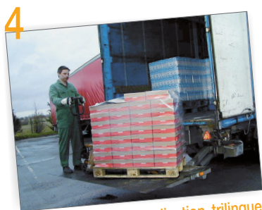
4 Le panneau de signalisation trilingue indique l'accueil des visiteurs et la réception des marchandises

🚛 Préciser exclusivement les horaires pendant lesquels le conducteur peut être accueilli dans les conditions réglementaires par l'entreprise d'accueil.